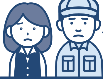
パート・契約社員