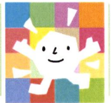
社会福祉法人 ことの海会

法人事務局〒856-0835大村市久原1丁目595-1 TEL:0957-47-5005 FAX:0957-47-5006