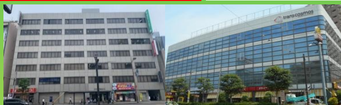
BPOセンター長崎中央(元船町)