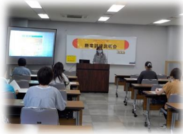
▲ 訓練実施施設の担当者から訓練内容の説明