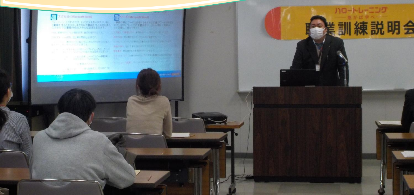
▲訓練実施施設の担当者から訓練内容の説明