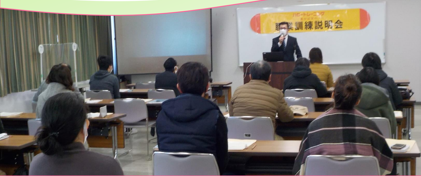
▲訓練実施施設の担当者から訓練内容の説明