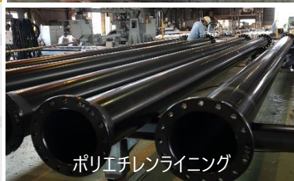
ポリエチレンライニング