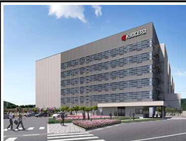
↑長崎諫早工場完成予想図↓

部品メーカーはスマホや車、AIなどを直接作るわけではありませんが、逆にそれらすべてに間接的に関わっています。京セラも特定の分野に限らず、人々の生活を豊かにする身の回りの様々な製品や技術に携わっています。それらに広く携わることができる考えると少しワクワクしませんか？ 安心して活躍いただくため、福利厚生も充実しています。ぜひ気軽にブースにお越しください！