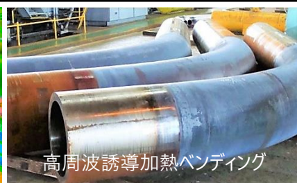
高周波誘導加熱ベンディング