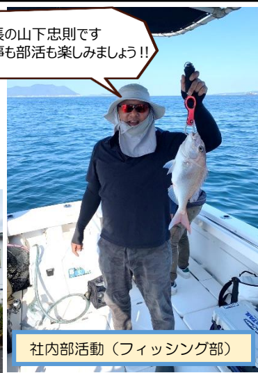
社内部活動 (フィッシング部)