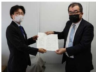
長崎県経営者協会