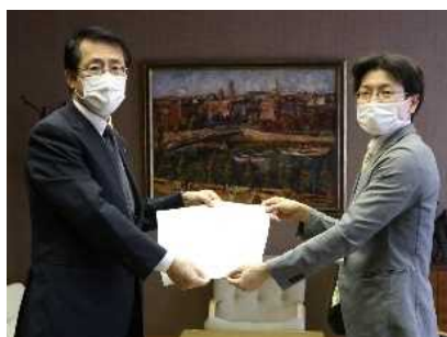
長崎県商工会議所連合会