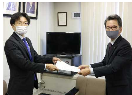
長崎県商工会連合会