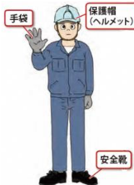
作業者に身につけてほしい望ましい装備例