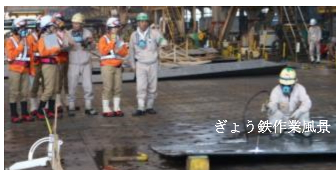
ぎょう鉄作業風景

その他にも、ぎょう鉄（ガスバナーで鉄板を熱し板を曲げる作業）や鉄板の切断加工など様々な作業にたくさんの女性労働者が従事されていました。