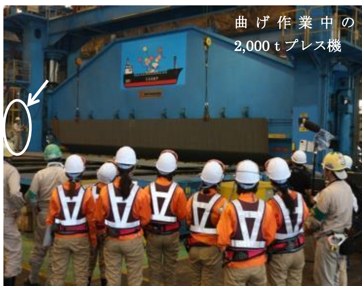
曲げ作業中の 2,000 t プレス機

大島造船所では、平成11年6月施行の「男女共同参画社会基本法」に先駆け、平成10年の採用活動より積極的に女性採用を行っており、現在約90名、特に技能職（現場作業職）の雇用人数が多く、33名もの女性労働者が現場作業職として活躍しておられます。