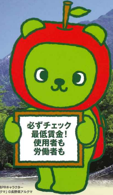
長野県PRキャラクター「アルクマ」©長野県アルクマ

★なお、下記の産業で働く労働者には、それぞれの特定(産業別)最低賃金が適用されます。