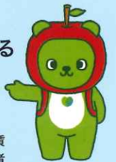
長野県PRキャラクター「アルクマ」©長野県アルクマ

※印刷・製版業は、令和元年12月31日以降の改定がないので、長野県最低賃金877円が適用されます。