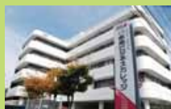
専門学校未来ビジネスカレッジ 本校舎

駐車場 / 自動車での通学をご希望の方には、施設周辺にある月極駐車場をご紹介します。