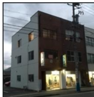
第二教室 訓練施設外観