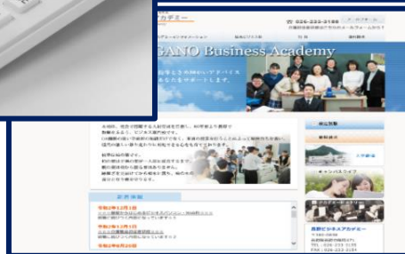
ホームページ作成