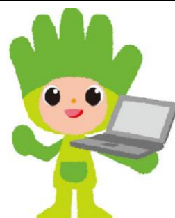
長野県ものづくり人材育成応援 キャラクター わざまる

適性検査、面接等により入校選考を実施します。 選考日には遅刻しないように必ず出席してください。 ※ 渋滞等で遅刻となる場合は必ず松本技術専門学校にご連絡ください。 鉛筆（シャープペンシル不可）と消しゴム、このチラシを持参してください。