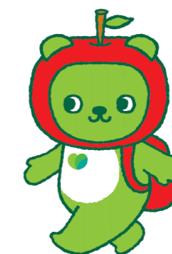
長野県PRキャラクター「アルクマ」 ©長野県アルクマ

応募者が少ないときは、訓練の実施を取りやめる場合があります。 訓練に通うための交通費、訓練生本人の所有に帰する教科書代等の費用は自己負担となります。（中面の「自己負担予定額」参照） 原則として訓練生全員に「目標資格」の取得に挑戦していただきます。 休校日は、土曜日・日曜日・祝日及び訓練施設が定める日です。