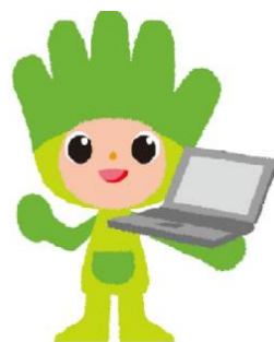
長野県ものづくり人材育成応援 キャラクター わざまる