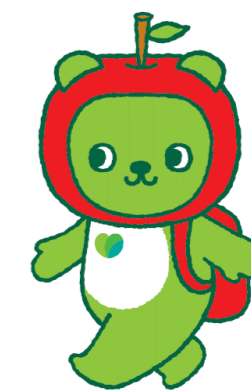
長野県PRキャラクター「アルクマ」 ©長野県アルクマ