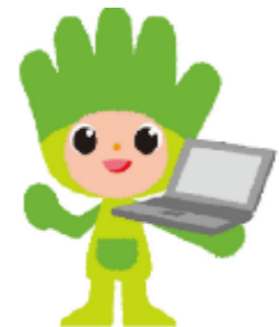
長野県ものづくり人材育成応援 キャラクター わざまる

・適性検査、面接等により入校選考を実施します。 ・選考日には遅刻しないように必ず出席してください。 ※ 渋滞等で遅刻となる場合は必ず松本技術専門学校にご連絡ください。 ・鉛筆(シャープペンシル不可)と消しゴム、このチラシを持参してください。