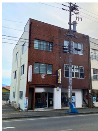
訓練施設外観（第一教室）