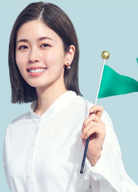
働き方改革 コンタクター 小芝風花