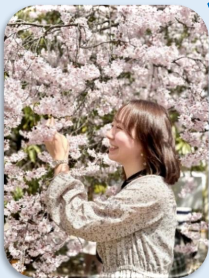
令和4年採用 ハローワーク長野

残業縮減や休暇取得にも積極的に取り組んでいるので、プライベートの充実も図りやすい職場です。 みなさんにお会いできる日を楽しみにしております。