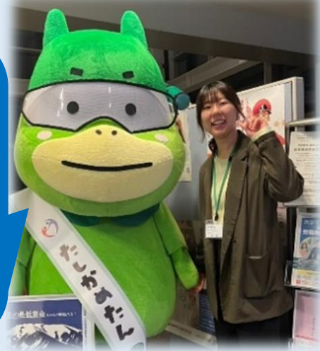
令和5年採用 松本労働基準監督署

労働に関する諸課題に対して、多方面からアプローチする機関であり、様々な専門的知識をインプット・アウトプットできるため、とてもやりがいを感じる職場です。