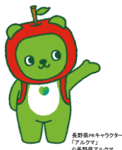
長野県PRキャラクター 「アルクマ」 ©長野県アルクマ

【照会先】長野労働局労働基準部 賃金室 賃金室長 浜 幸好 室長補佐 宮澤 明芳 賃金指導官 荒河 美穂 (代表電話) 026(223)0555