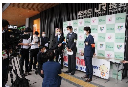
【決意表明時の場所と配置イメージ】