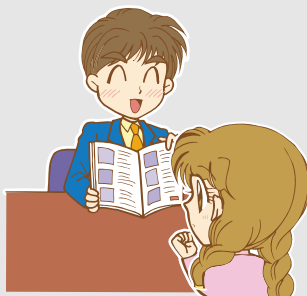
②面接 / 相談