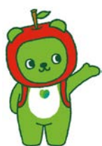
長野県のキャラクター 「アルクマ」 ©長野県アルクマ

長野労働局(労働局長 久富康生)は、令和5年10月1日の長野県最低賃金引上げ(時間額 948円)に際し、長野県、連合長野と協力して、JR長野駅前で周知活動を行います。当日は長野県最低賃金広報大使である長野県PRキャラクター「アルクマ」と、連合長野マスコット「ユニオニオン」の参加による出陣式を行った上で、下記の活動を行います。