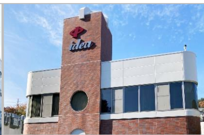
イデアシステム(株)