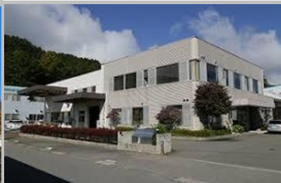
(株)山村システム技研