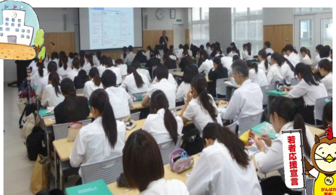
社会人として有効な知識を取得するため多くの学生が参加

生から社会人になる上で必要となる法令・制度について実例を交えながら説明しました。就活中で多忙の中、250名の学生さんに参加していただきました。