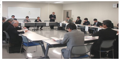
緊急会議における協議模様

また局として初めて3月22日に死亡労働災害多発警報を発令したことを報告。警報発令後に作成する「取り組むべき労働災害防止対策」等について意見交換し「啓発用ポスターにも具体的な取り組み