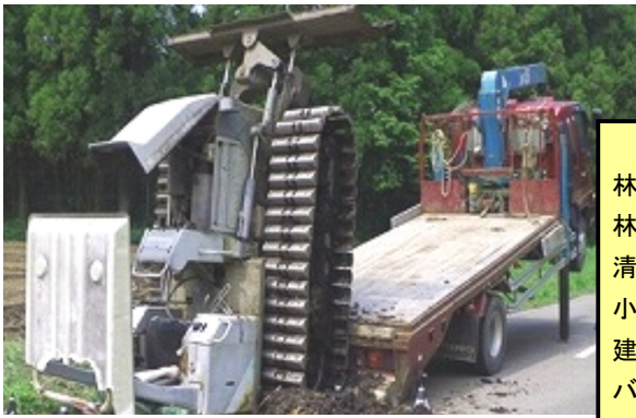
ポスターに使用した事故事例