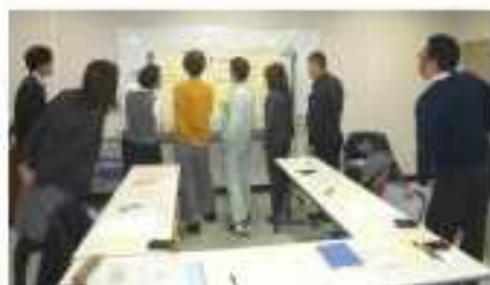
みんなで問題点を整理し原因を探った