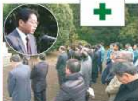
挨拶する菱井署長（左上丸）

受表彰された方々については長年にわたり大変お世話になりました。これからも引き続き労働行政並びに宮崎労働局をよろしくお願ひします。