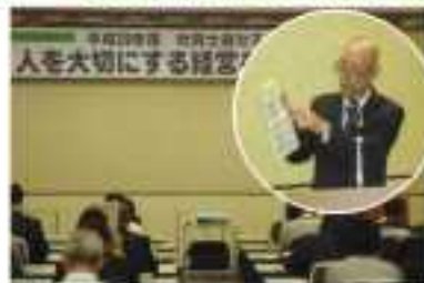
等説明する上田雇用環境均

宮崎県社会保険労務士会が1月、宮崎労働局委託事業として県内3か所で、セミナー「人を大切にする経営をめざして」を開催し計206人が参加。特別講演としてKIGURUMIBIZ株式会社（宮崎会場）株式会社小田工業（延岡会場）益山商工株式会社（都城会場）の3社から、自社の働き方改革等について発表がありました。「ノー残業デーを始めたら、5時に終わるために効率的に仕事をするようになり、予想外に売上が伸びた」話など、地