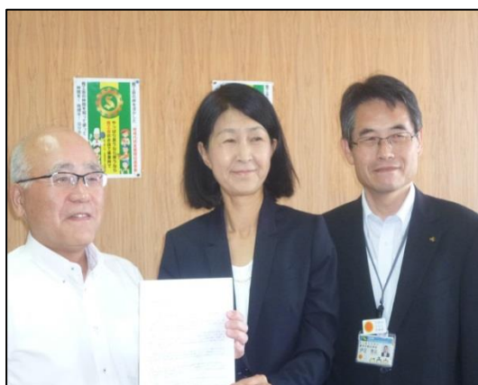
6/5 宮崎県商工会联合会 田原専務（左）