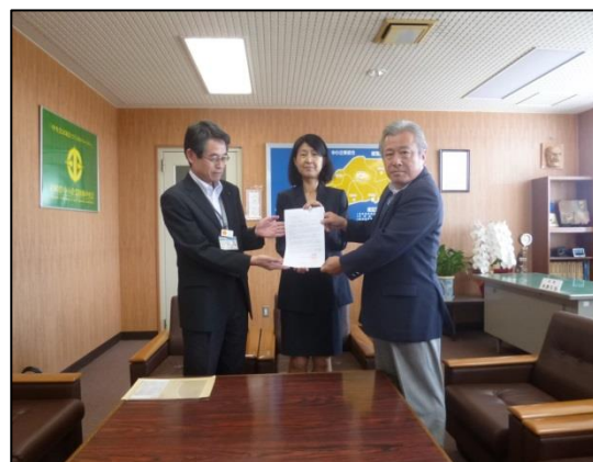
6/5 宮崎県中小企業団体中央会 小八重専務（右）