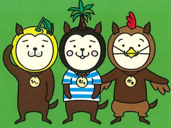
宮崎県シンボルキャラクター「みやざき犬」