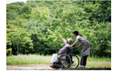
介護イメージ写真