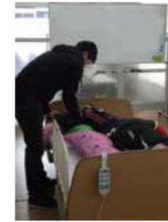
介護職員初任者研修実技風景