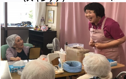
〈化粧品療法レクリエーション〉