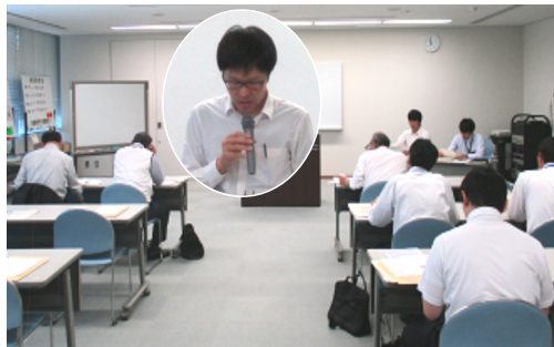
法制度を説明する端監督官