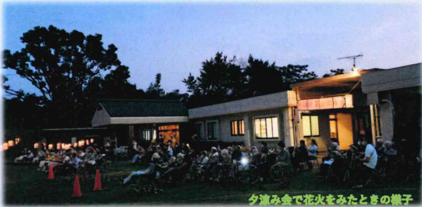
夕涼み会で花火をみたときの様子