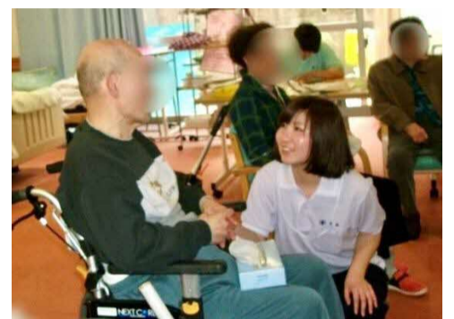
笑顔がたくさん職場です

●調理員…高齢者施設において、利用者の食事を提供します。調理、盛り付け、配膳、片付け等。食事は健康を維持する上でとても重要なものであり、利用者の生活において大きな楽しみの一つです。食事面から利用者の健康と喜びに貢献できるお仕事です。