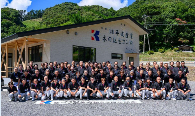
木田組生コングループ 生コン事業開始50周年記念 令和6年8月24日