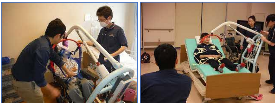
<抱えない介護（リフト）の研修風景>