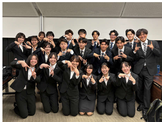
2026年度新入社員21名（東京研修中の集合写真）

4月には、本社のある東京へ新入社員21名とともに出張し、入社式および約2週間の研修に引率として参加しました。現在、新入社員は宮崎に戻り、各配属先での現場研修に日々励んでいます。最後になりますが、採用担当としてみなさんにお会いできること、そして一緒に働ける日を楽しみにしています！