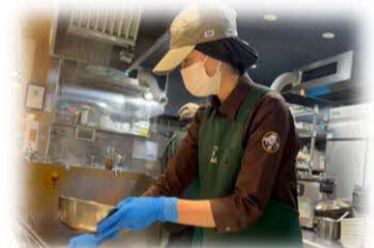
調理・盛付け など