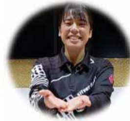
カウンター・お呼び出し対応