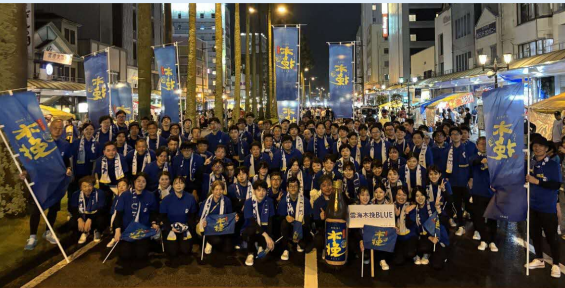
2025年えれこっちゃん宮崎 総踊り参加