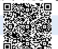
ハローワーク求人

この企業が気になった方は、お近くの紹介担当までお声がけください！ 事業所番号：4606-613412-8