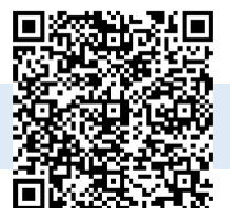
ハローワーク求人

この企業が気になった方は、お近くの紹介担当までお声がけください！ 事業所番号：4504-2782-2