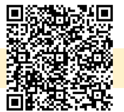
ハローワーク求人

この企業が気になった方は、お近くの紹介担当までお声がけください！ 事業所番号：4504-3655-8