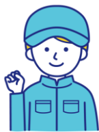
修了生の声 (30代 女性)

CADとNCについては全く知識のないところから入りましたが、基礎と実践の授業で解りやすく、楽しい訓練生活でした。数学が苦手な私には難しい部分もありましたが、製造業に関心と興味を持ち、やる気と自信が持てました。