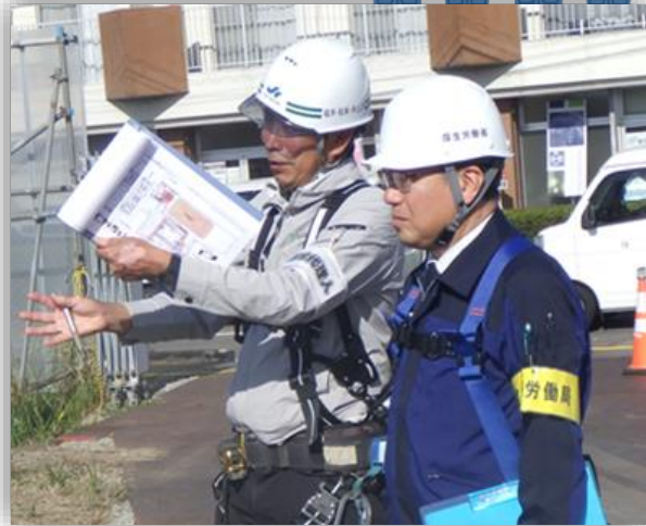
安全管理状況等を確認する吉越労働局長（右）