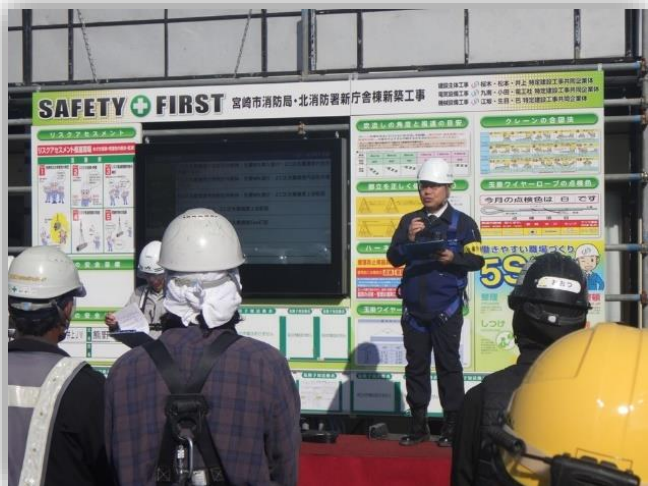
安全作業の徹底を呼び掛ける吉越労働局長