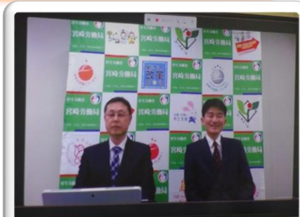
左から、柳田担当官、向田職業安定部長