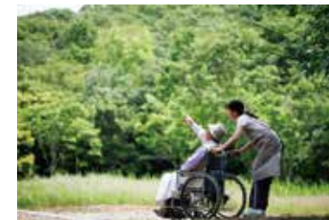
介護イメージ写真