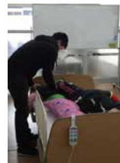
介護職員初任者研修実技風景