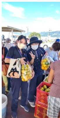
何事にも楽しんでます!