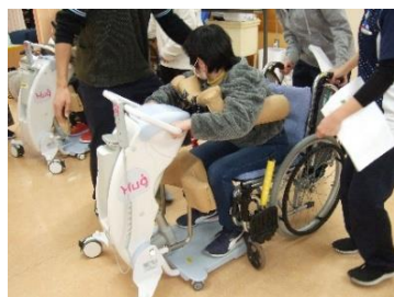
移乗ロボット研修の様子