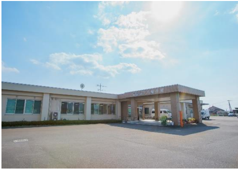
特別養護老人ホーム「八幡の里」