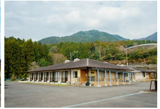
グループホーム「顔なじみ」