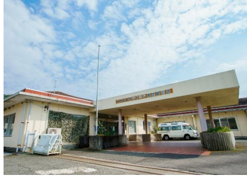
特別養護老人ホーム「あけぼの園」