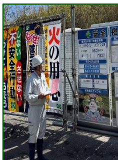
土木施工管理技士 40代 男性

土木工事の施工管理に従事しています。災害復旧工事が終わった後、地域の皆様から「ありがとう」と声をかけて頂くことがあり、とても嬉しくやりがいを感じます。会社の制度を利用して10個以上の資格や免許を取ることができ、スキルアップを応援してくれる会社だと思います。