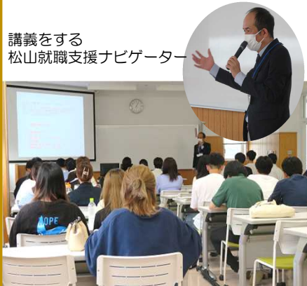
講話をする 松山就職支援ナビゲーター

5月23日から3回に分けて、宮崎国際大学で194人に向けて労働法講話を行いました。労働法の講義というより、就職活動や就職して実際に働くときに知っておいてほしいことや、学生アルバイトで起こりそうなトラブル事例を挙げながら説明をしました。