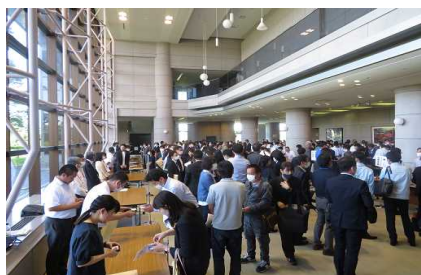
企業と学校担当者との交流会の様子